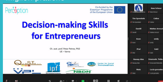
Entrepreneurship webinar - 16 giugno 2023