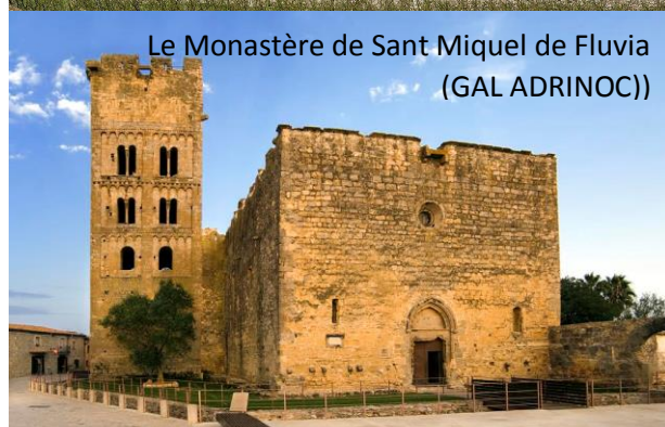
Le Monastère de Sant Miquel de Fluvià (GAL ADRINOC)