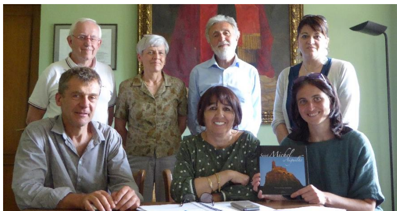
Rencontre du 27/05/2017 : GAL Escarton E Valli Valdesi, Melting'Potes, Aiguilhe, GAL Velay

Dans chaque territoire partenaire , les animateurs de sites dédiés à Saint Michel, les organismes en charge de la promotion touristique et de nombreux citoyens européens regroupés en associations (chanteurs, artistes, photographes, producteurs locaux,...) sont mobilisés autour de ce projet fédérateur qui fera rayonner les sites et territoires dédiés à Saint Michel en Europe.