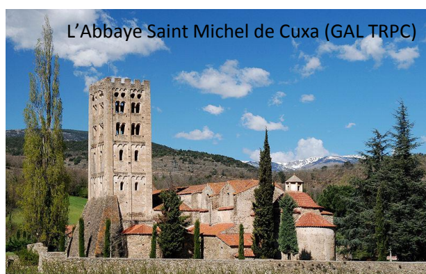
L'Abbaye Saint Michel de Cuxa (GAL TRPC)