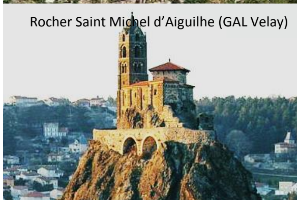
Rocher Saint Michel d'Aiguilhe (GAL Velay)