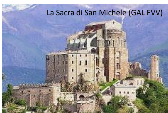
La Sacra di San Michele (GAL EVV)